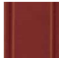
07 Rosso Red красный цвет