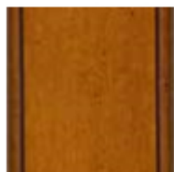
76 Noce Walnut орех