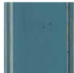
13 Aivo Al-force blue темный цвет