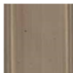
51 Fango Clay brown цвет грязи