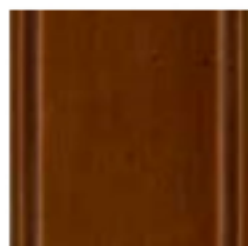
77 Noce scuro Dark walnut темныйорех