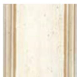
05 Bianco Mandorla Almond white Белый миндальный цвет