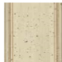
06 Coloniale Khaki Green колоннальный цвет