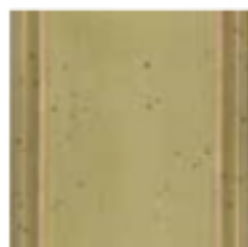
08 Verde muschio Moss green зелёный мускуса цвет