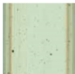
41 Verde malva Malva green зелёный мальвы цвет