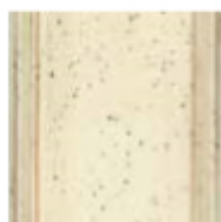
17 Beige Creta Crete beige бежевый цвет глины