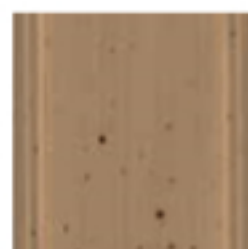
60 Tortora Dove grey бледно-коричневый цвет с сероватым оттенком