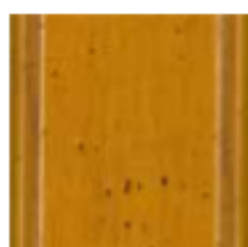
19 Ciliegio nevada Nevada cherry вишня Невада