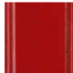
22 Rosso rubino Ruby red красный рубиновый цвет