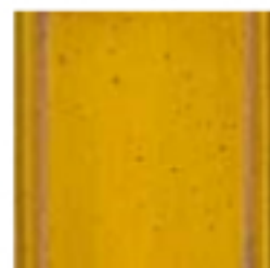
04 Giallo miele Honey yellow желто-медовый цвет