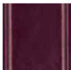
20 Melanzana selvatica Wild aubergine баклажанный цвет