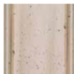
18 Glicina Wisteria глициний цвет