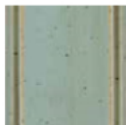
26 Turchese pastello Pastel turquoise пастельно-бирюзовый цвет