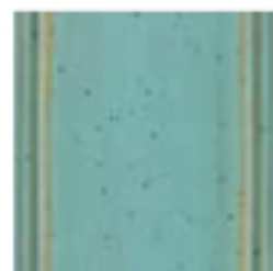
40 Azzurro polinesia Polynesian blue голубой цвет